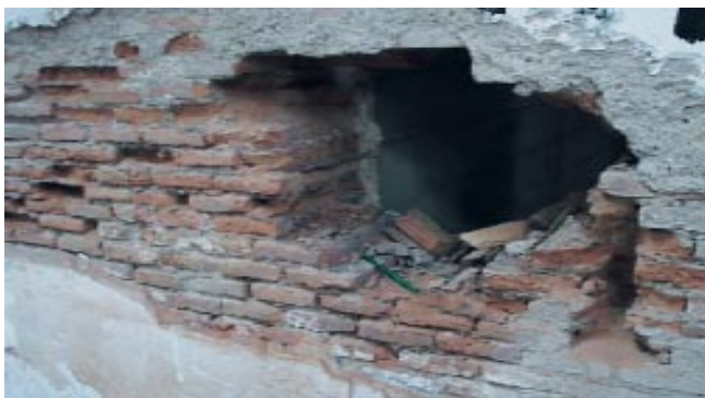
Detalle de una de las catas realizadas en el muro. Véase el material utilizado, su composición y su espesor.

La aparición de grandes áreas afectadas por humedades de ascensión capilar, se debe fundamentalmente a dos motivos: el primero de ellos propiciado por las roturas de la red de saneamiento que posibilitan el encharcamiento del terreno y, en segundo lugar, a la propia tipología de la obra, formada por muros de carga y soleras directamente apoyadas sobre el terreno, sin que existan elementos que impermeabilicen los encuentros.