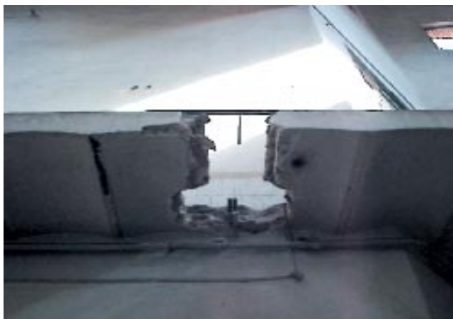
Detalle de la zona de forjado de donde se extrajo una porción de un perfil metálico, para su ensayo de laboratorio.

La rotura generalizada de la clave de arcos y dinteles de fábrica de ladrillo en huecos de puertas y ventanas, se debe fundamentalmente a la aplicación de fuertes cargas puntuales sobre los muros resistentes.