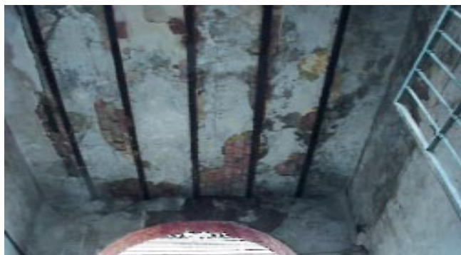
Aspecto general de uno de los forjados de techo del edificio, con un avanzado proceso de corrosión de sus viguetas metálicas.

la tensión admisible de cálculo de la fábrica de ladrillo macizo cerámico, determinada según la Norma NBE FL-90 de muros de fábrica es de 18 Kp/cm 2 . Por tanto, para los muros exteriores se adopta una tensión admisible de cálculo de 8 Kp/cm 2 y para los muros interiores de 18 Kp/cm 2 .