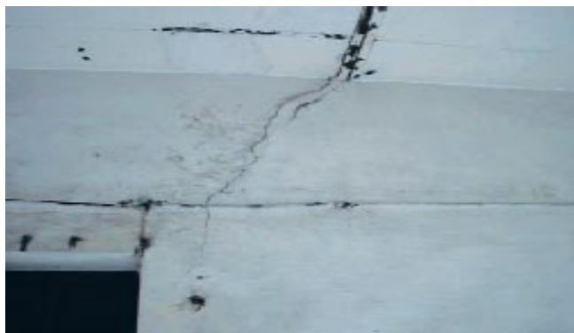
Detalle del cuadro fisurativo observado en una zona de estructura.

se deben definir minuciosamente las dimensiones exactas de cada uno de los elementos constructivos del inmueble.