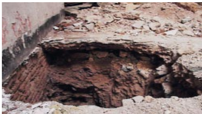
Detalle de una de las catas de inspección en el terreno, para la toma de muestras y para acceso a la cimentación de los muros.

anteriormente. Se acabará el informe con las conclusiones a las que todo ello nos lleva, así como las recomendaciones que consideramos de interés. En nuestro caso concreto y para el edificio singular en Murcia que estamos estudiando, en base a las inspecciones "de visu" realizadas al edificio, a la inspección de las calicatas y calas abiertas, a la investigación de los materiales mediante ensayos de laboratorio y a los trabajos de gabinete de comprobación estructural, las conclusiones y recomendaciones más significativas fueron las siguientes: